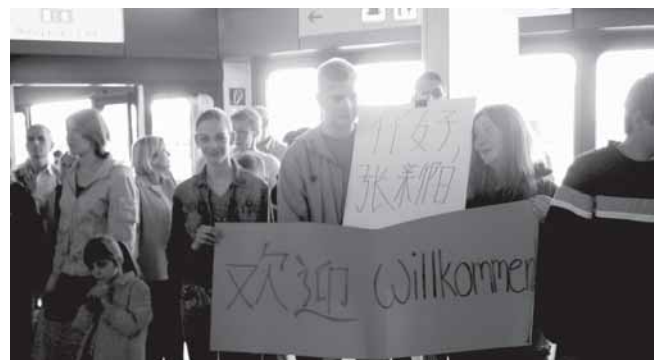
Warten auf die Gäste aus Peking: Begrüßung auf Chinesisch

Namentlich gekennzeichnete Artikel spiegeln nicht unbedingt die Meinung der gesamten Redaktion wider.