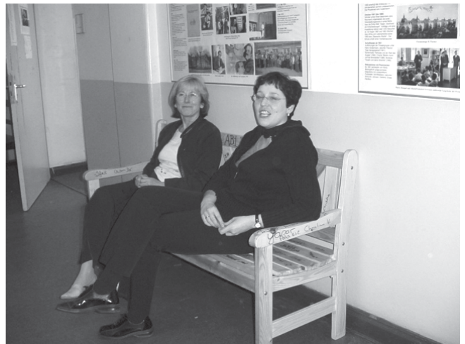
Einweihung der Abibank 2005: Spende für müde Pädagoginnen