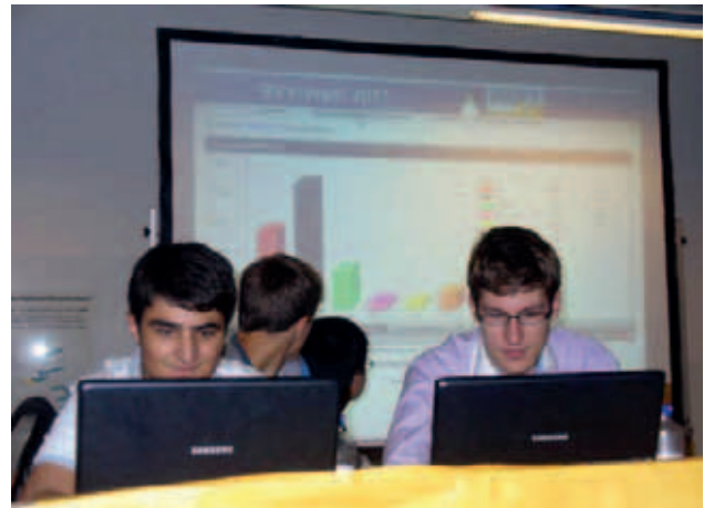
BVV-Wahl Berlin 2011: Schüler bei der Eingabe der Wahlergebnisse