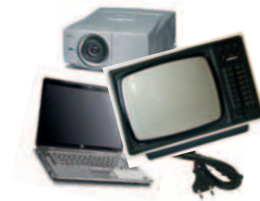
Vergebliche Pädagogik im Unterricht – wenn die Technik streikt