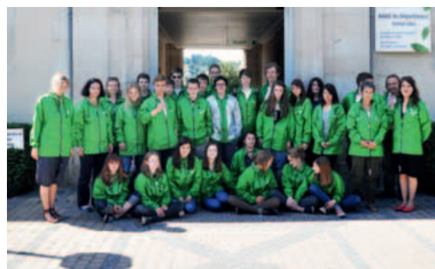
Nach dem Empfang im Conseil Général in Tulle - in den leuchtend grünen Regenjacken der Corrèze! („Pays Vert“ - Grünes Land)